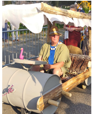
Winnende creatie van de Overweg